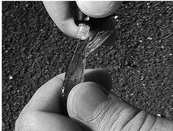
▲美国高健康水产养殖公司正在给对虾进行生物标记

我们的亲虾为 GxTVR，是因为他们同时结合了生长速度快和抗南美白对虾桃拉病毒的遗传特性。在泰国的一些养殖场，我们的 GxTVR 亲虾的生长速度可以达到 60 天的 10g，70 天的 14g，100